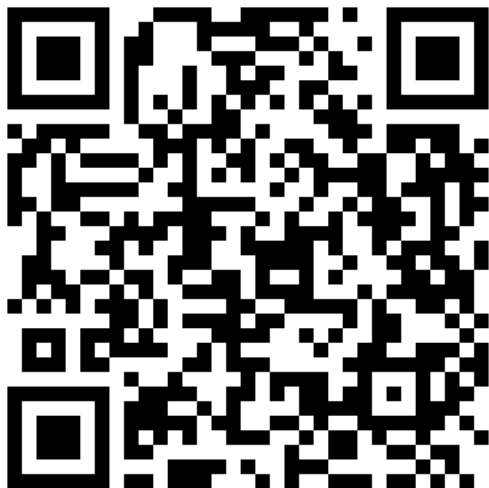
Сайт образовательного проекта «Мой район в годы войны»